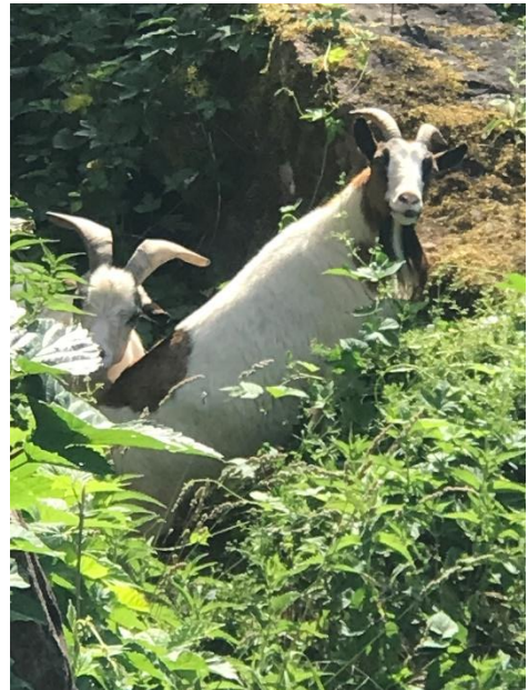
Die Burg wird eingenommen