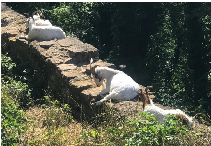
Die Familie ist wieder komplett